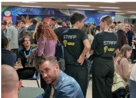
La Nuit des Carrières 2025.

Les ateliers proposés chaque semestre abordent des thématiques essentielles: connaissance de soi, identification et valorisation des compétences, construction d'un CV ou d'un e-portfolio efficace, et mise en place de stratégies de réseautage. L'approche est à la fois introspective et pratique, permettant aux participantes et participants de mieux se connaître, de clarifier leurs objectifs professionnels et d'acquiescer des outils immédiatement mobilisables. Certains de ces modules sont intégrés à des parcours académiques, tels que des Summer Schools ou des options spécifiques.